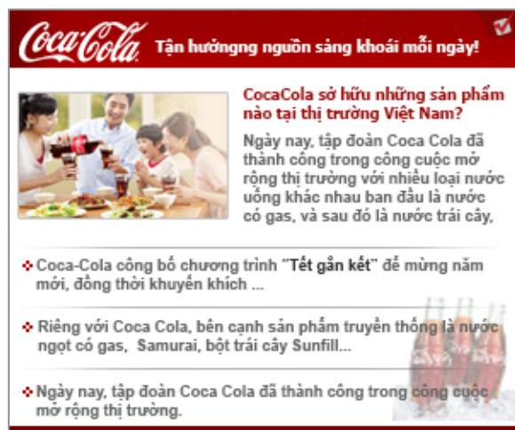
Mẫu 2: 4 tin, trong đó 1 tin kích cỡ lớn, 3 tin kích cỡ nhỏ hơn