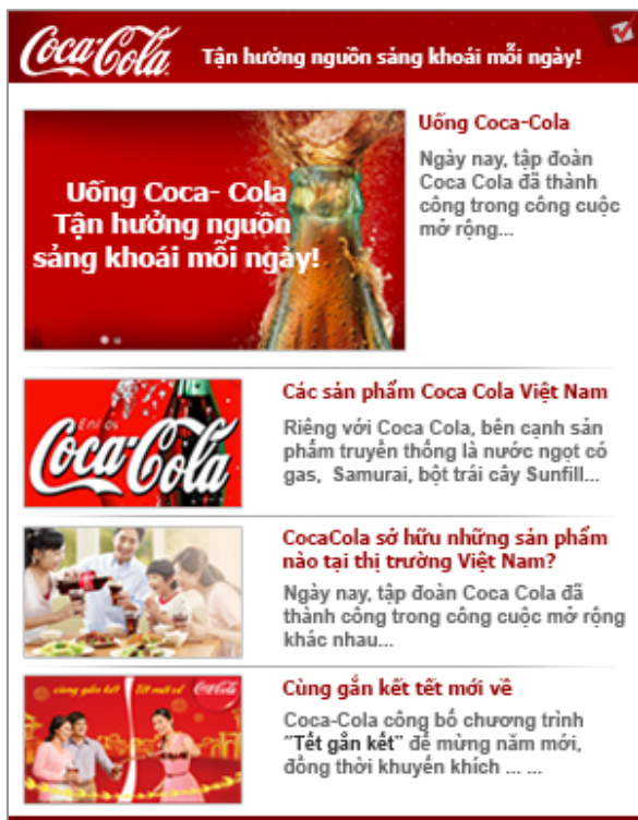
Infobox 1 - Box 300 x 385