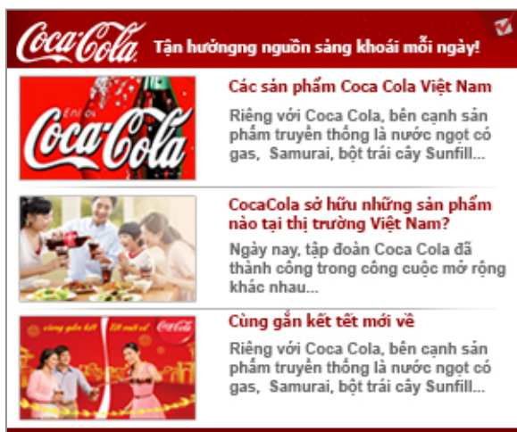
Mẫu 1: 3 tin kích cỡ bằng nhau